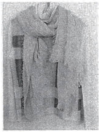
カシミアの繊維の構造

色のないファッションは寂しいし、UT Oでは色は とても大事でいい色にこだわっています。しかし現在 の技術では化学染料を使わないというのは難しいの で、何が何でも化学染料は使わないというわけではあ りません。